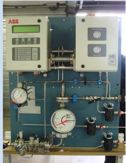
armoire mélange Cl 2 /N 2